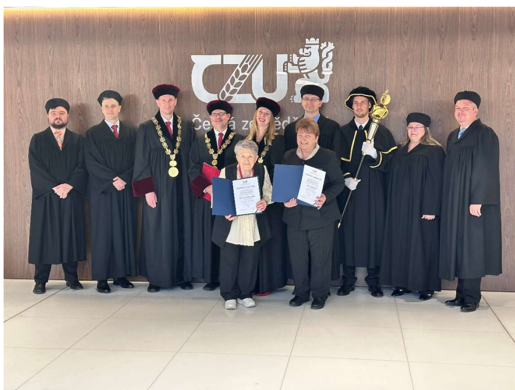
Promoce dvou studentek U3V v PRAZE