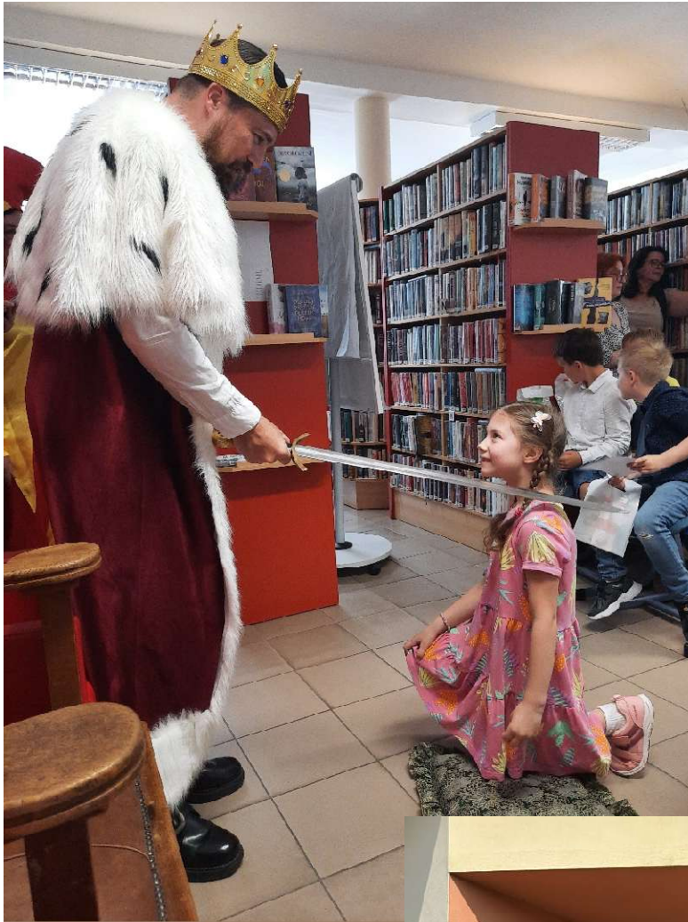
Pasování ZŠ Nádražní