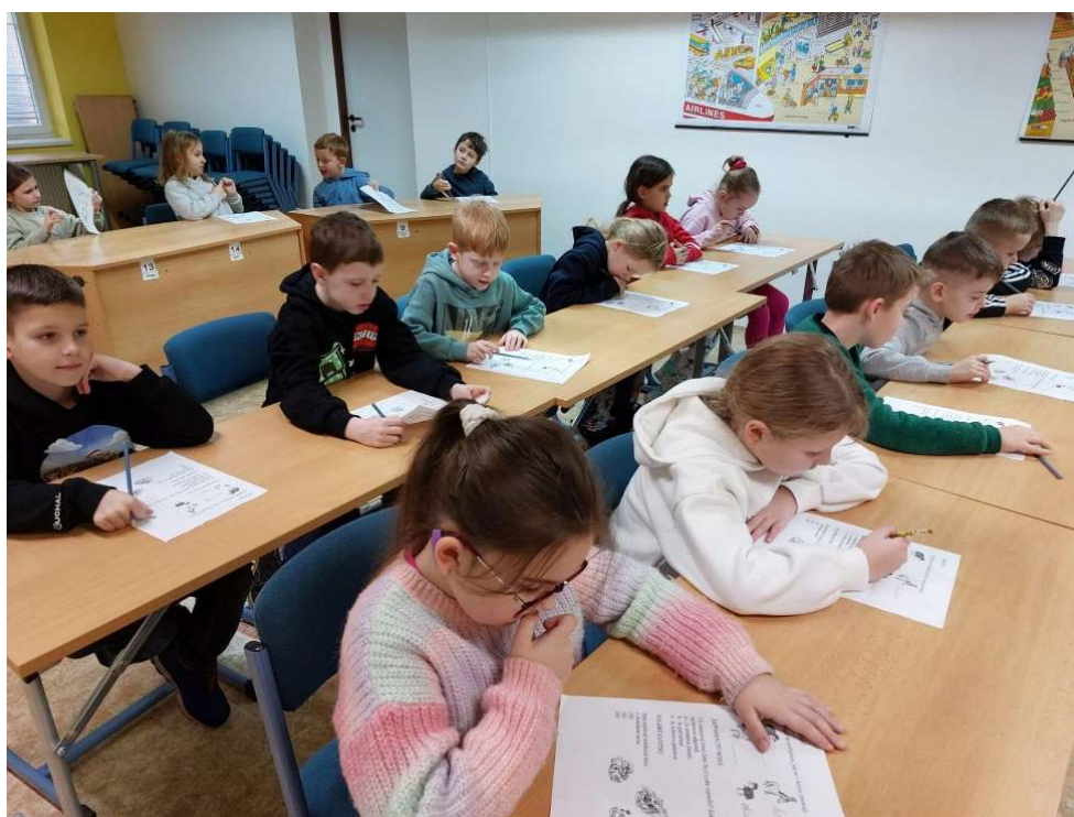
Beseda Chobotem sem, chobotem tam – 2. třída ZŠ Komenského