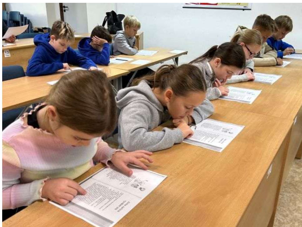
Beseda Roald Dahl – 4. třída ZŠ Komenského