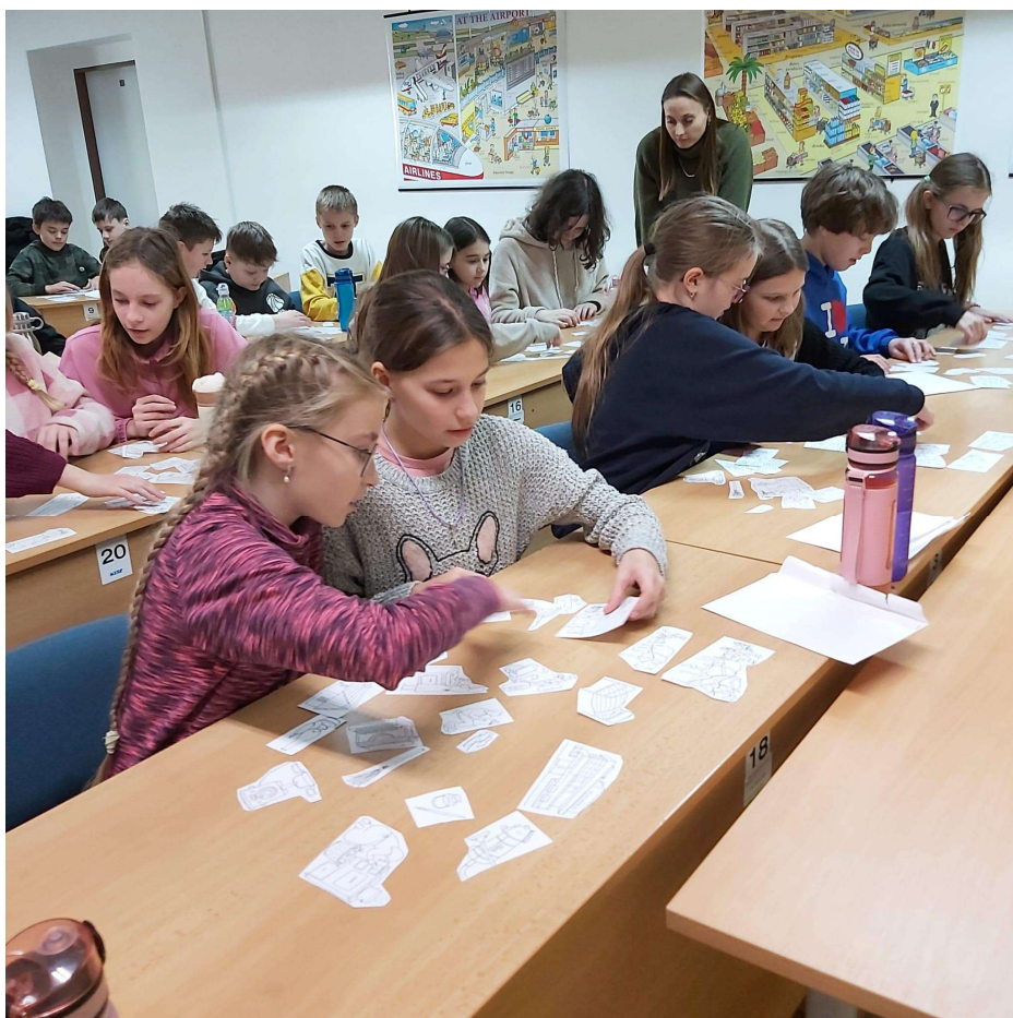
Beseda Ztraceni v čase – 5. tř. ZŠ Komenského