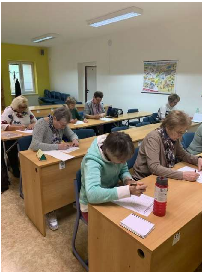
Hrátky s pamětí

V rámci NTTP se uskutečnilo v březnu také odpoledne „ Hrátky s pamětí “. Účastníci absolvovali spoustu paměťových cvičení.