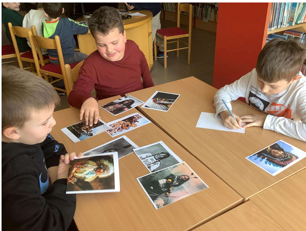
Beseda Dědo, ty jsi indián – 2. třída ZŠ Komenského

V tomto roce jsme realizovali v knihovně 63 vzdělávacích a 16 kulturních akcí. Jednalo se především o pořady pro žáky MŠ, ZŠ, Gymnázia a SOU. Pedagogové si mohou vybrat z naší široké nabídky besed pro jednotlivé věkové skupiny. Jejich seznam naleznou i na našem webu. Tradičně jsme pořádali několik výstav a přednášek.